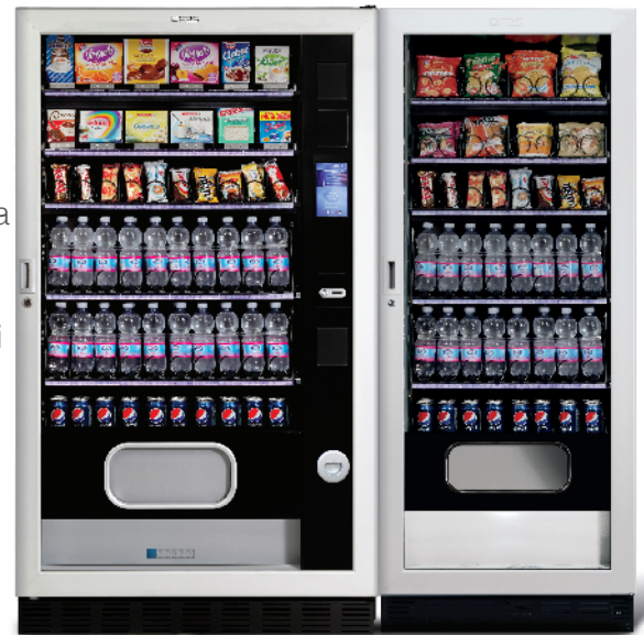
Faster 1050 2T