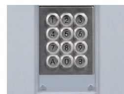
Tastiera illuminata protetta da lexan 5 mm