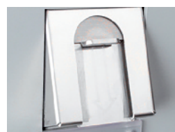
Inserimento monete antivandalico