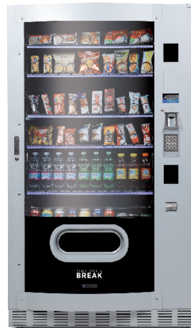
Skudo Max GCD 1050