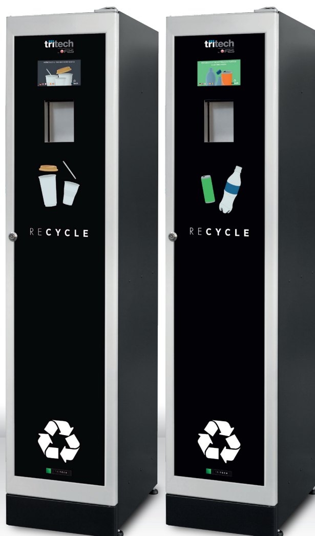
TRITURATORE BICCHIERI TRITECH TOWER TOUCH Capacità: n.1.700 bicchieri Cod. 987025MMAA031