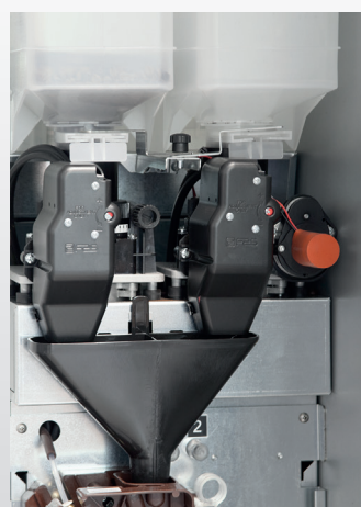
Regolazione automatica della macinatura su caffè top