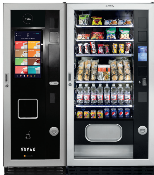
Winning T + Faster TMT