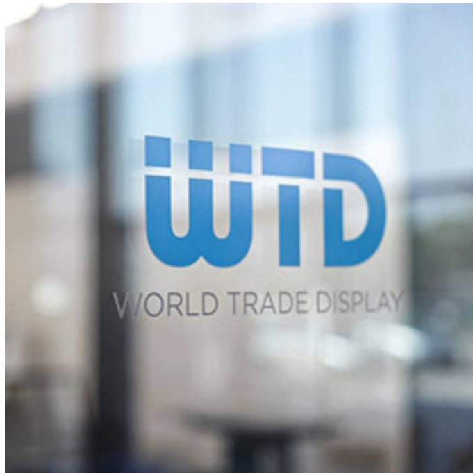
Galleria eventi: img 5: