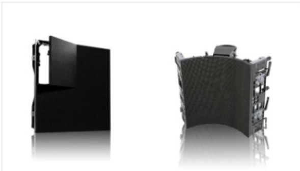
LED Brackets ACCESSORIES Series