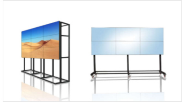
LCD Brackets ACCESSORIES Series