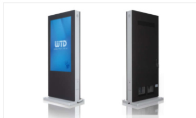
Outdoor MONOLITH Series