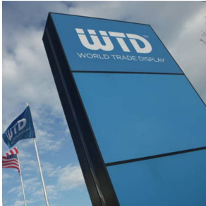
Galleria eventi: img 4: