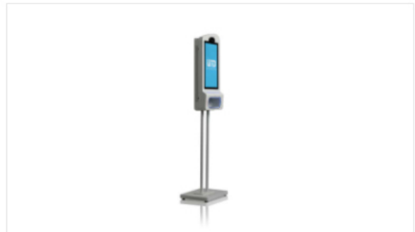
Gel Sanitizer Dispencer NITIZ Series