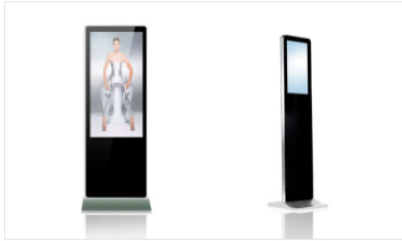
Indoor SIRIO Series