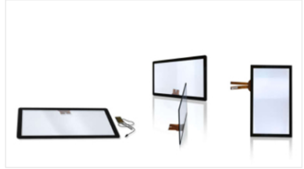
Outdoor TES Series