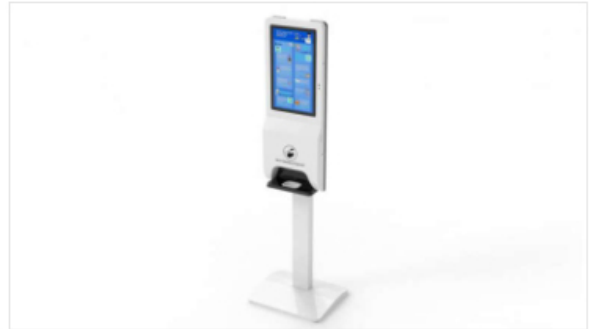
Gel Sanitizer Dispencer DISPY Series