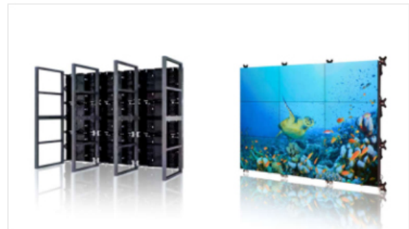
LED MODY Series