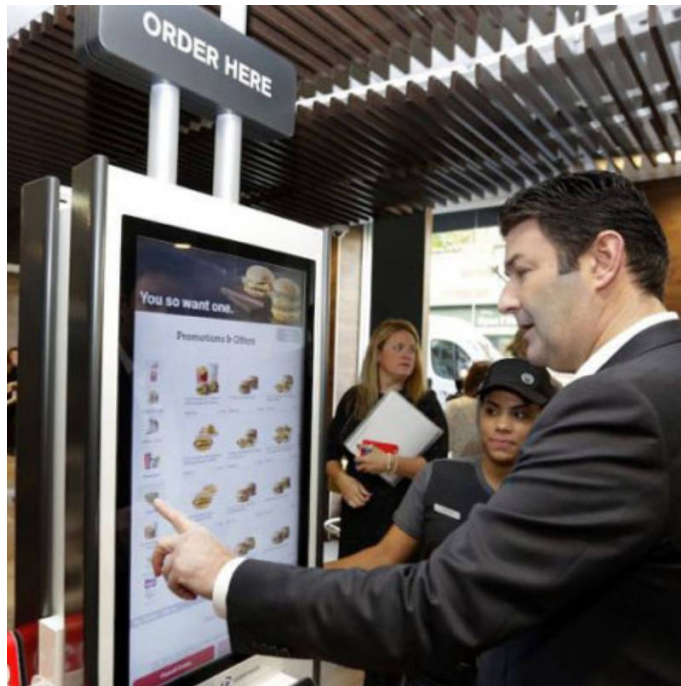
Galleria eventi: img 2: