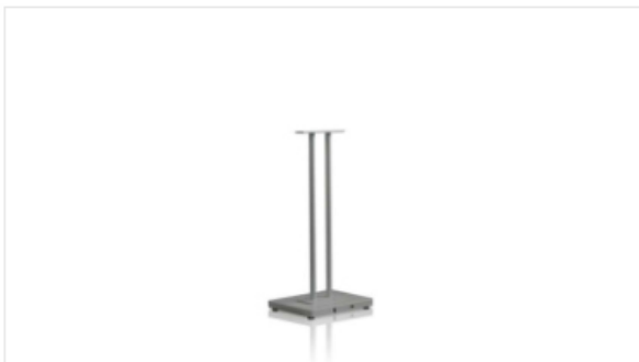
Stand DISPY, NITIZ, PADY Series