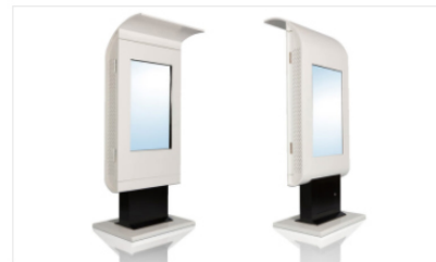
Semi/ Outdoor WAVE Series Double Display