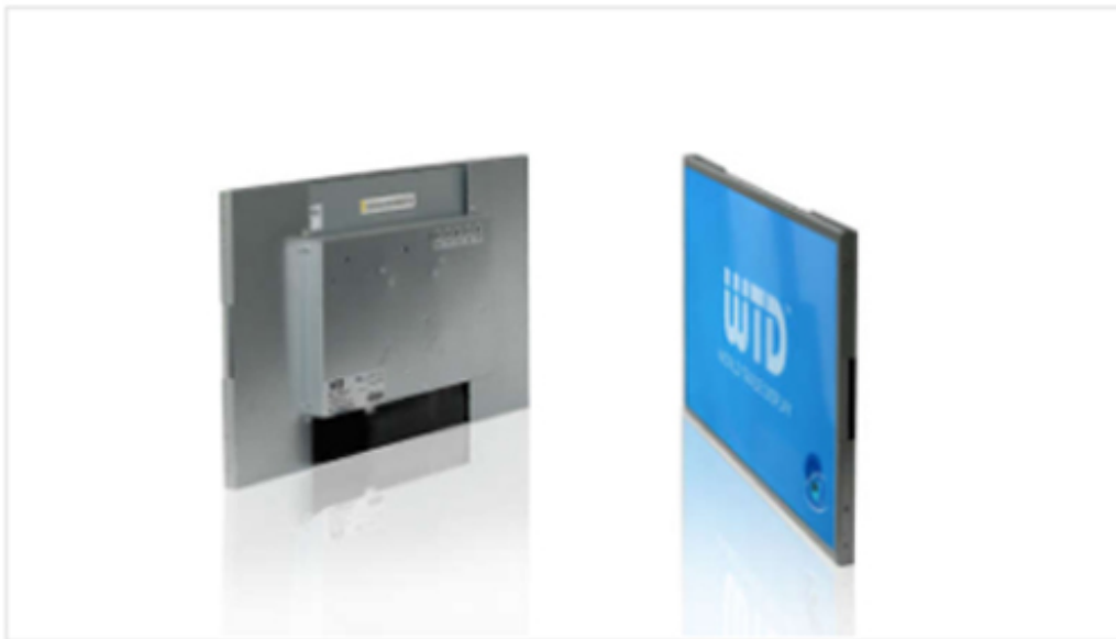
Industrial IOWE Series