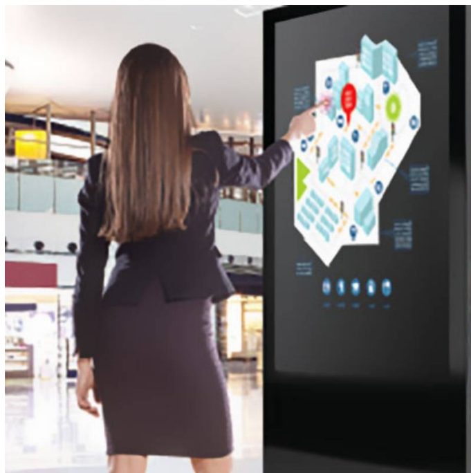
Galleria eventi: img 3: