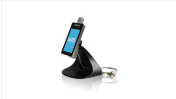
Pad Sanitizer PADY Series