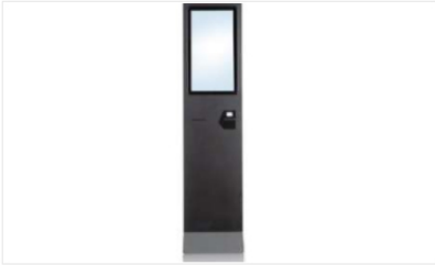
Order Kiosk SLY Series