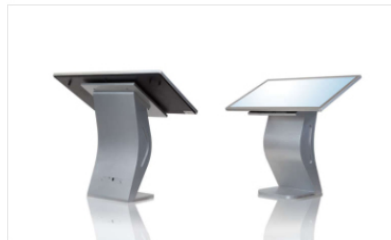
Indoor STYLUS Series