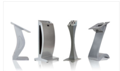
Stand ZEN, STYLUS, YEN, TEN, DESK Series