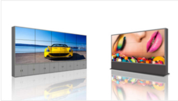
LCD WIDO Series