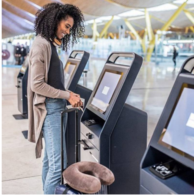
Galleria eventi: img 6: