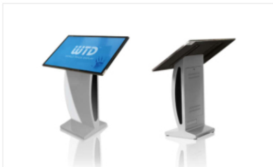
Indoor NUBY Series