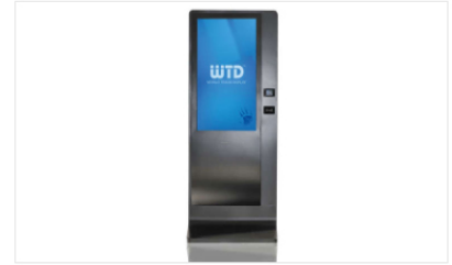
Order Kiosk YESS Series