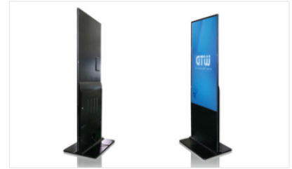
Indoor JOY Series