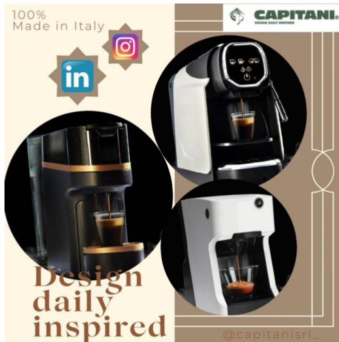
Galleria eventi: img 5: