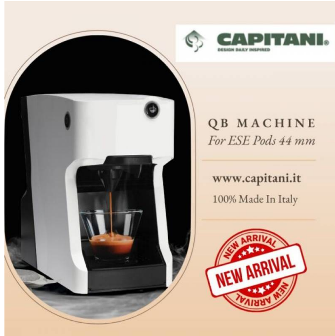
Galleria eventi: img 4: