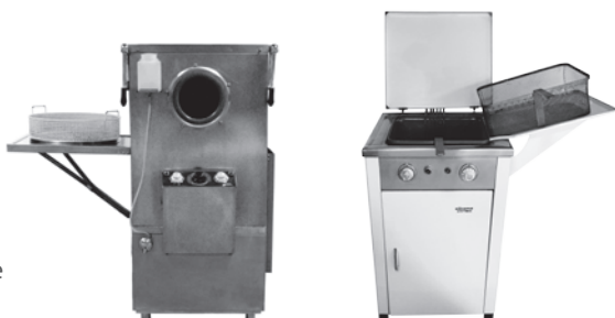
Le prime macchine firmate Elframo

“L’obiettivo era costruire macchine per modernizzare il mondo della ristorazione.”